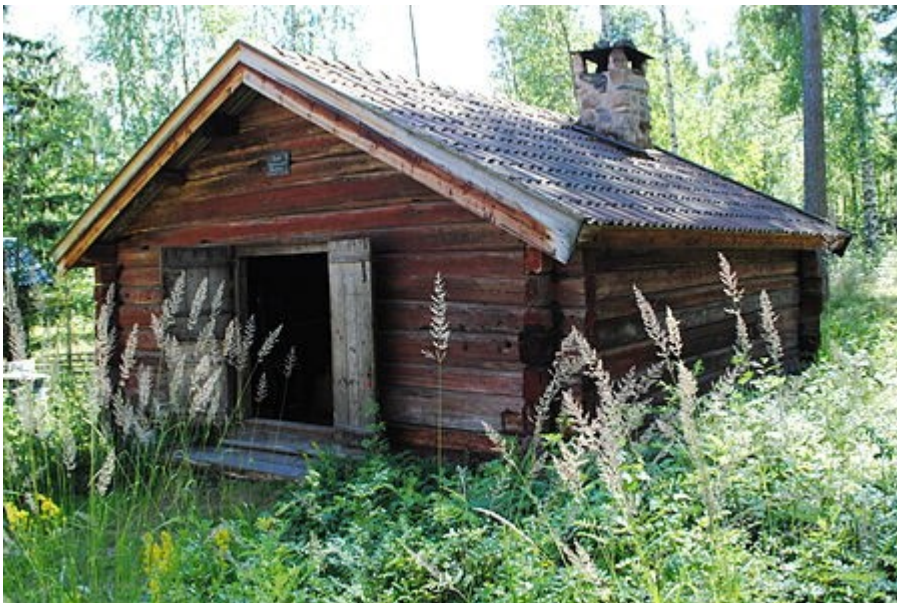
Smedjan, vars första version torde ha byggts ca 1710.

Denna och andra dendrokronologiska studier av T. Axelson återfinns på taxelson.se/dendro/obj/