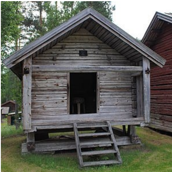
Stolpboden ursprungligen från Kuntberget 1835

Golvtiljorna består av stockar som bilats på två sidor. Gåtarna är kraftiga och välgjorda med ungefärligen kvadratisk tvärsnitt för den synliga delen, och spåren av fiskstjärttyp. Gåtarna är gjorda av klovor. På den vänstra gåten finns året 1871 inskuret.