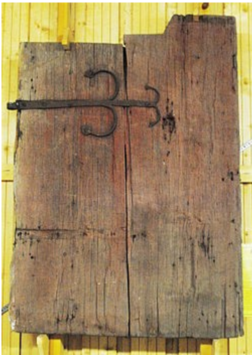
Dörren, framsidan med medeltida beslag

1969 beskrev Olle Homman dörren och gjorde då bedömningen att den var från perioden 1450-1500 i enligt med paralleller i bl.a Ornässtugan, Rankhyttan och Flintgard på Sollerön. (Numer är Ornäsloftet dendrodaterat till 1503 och Rankhyttan 1492). Det ovanliga och tidstypiska är konstruktionen att sammanfoga med genomgående käppar i hål som borrats igenom båda dörrplankornas hela bredd, innan de sedan tunnats ut till önskad tjocklek. I detta fall blev uttunnningen av virket lite för kraftig, så att käpparna delvis blottades. Att den visar sig vara från omkring 1420 och därmed före det angivna intervall, är intressant, eftersom det helt saknas daterade byggnader från Dalarna från tiden 1367 till 1447.