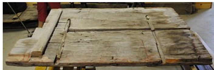
Dörren, baksidan med de blottade käpphålen