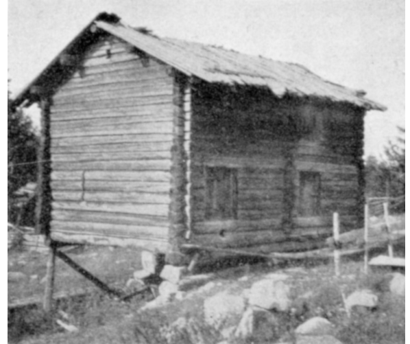
På ursprunglig plats i Brötjärna 1920, med senare påbyggt loft.

Den 16 september 2022 tog jag i tre av golvtilljorna i parboden från Brötjärna som står på hembygdsgården i Mockfjärd, 60.51089 , 14.97653 . Proven togs med tillväxtborr underifrån i vänstra delen av byggnaden (B-sidan, tilljorna nr 2, nr 1 och nr 4), där det går att krypa under den. Alla undersökta stockar är av tall och två av proven kan dateras med yttersta ring 1619, medan det tredje har yttersta ring ett fåtal år tidigare, men med tynande ytved där ytterligare extremsmala eller absenta ringar mycket väl kan dölja sig. De provtagna stockarna är sinsemellan ganska olika, och skulle eventuellt kunna komma från olika bestånd – virke från sedimentjordarna nära älven kan ibland vara spretigt även om det vuxit nära. Två av proven passar mot varandra. Vart och ett av proven kan dateras mot olika referenser. Det ena provet (229A01) har bäst, men inte särskilt bra, korrelation mot några referenser från Gästrike- och Hälsingekusten(!), och passar dåligt mot dalakronologier och de andra proven.