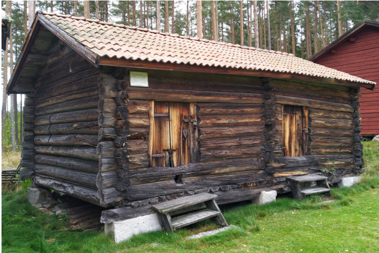
Parboden i september 2022, utan det påbyggda loftet.