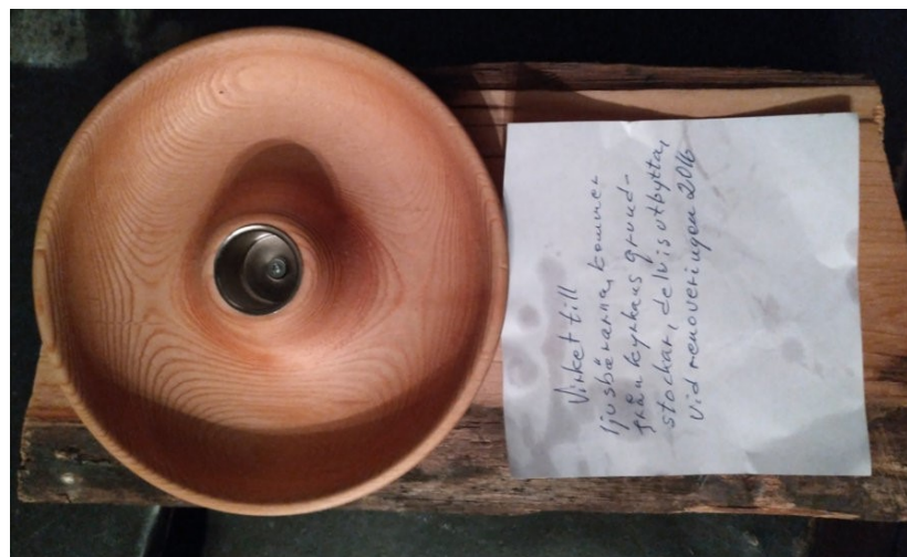
En av de fyra ljusstakarna stående på det senare analyserade provet under.

I samband med gudstjänsten den 4 oktober 2020, i Äppelbo kyrka, 60.4896, 14.0047 (WGS 84), förärdades 1 hon fyra svarvade ljusstakar, tillverkade av delar av en syllstock som bytts ut vid reparationen av kyrkan 2016. Jag fick samtidigt en del av samma stock för dendrokronologisk analys. Prov togs genom att en skiva sågades och slipades. 131 årsringar kunde mätas i det 14cm × 13cm stora provet. Dessa låter sig med full säkerhet dateras mot flera regionala referens kronologier och visar sig ha bildats under perioden 1556-1687. Från innersta mätta ring och