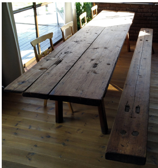
Bord och bänk från Skålö.