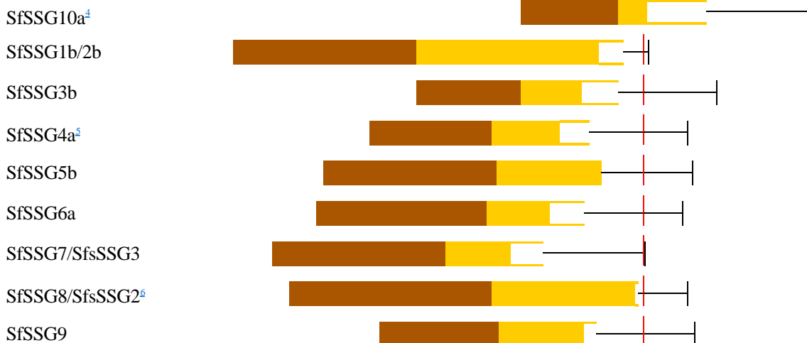
Diagram över provens tidsmässiga omfattning

Analysen ger vid handen att den nuvarande sockenstugan är väsentligt yngre än vad som i historiken (se bild) antagits. Dess nuvarande form kan den inte ha fått förrän tidigast 1872, även om den antagligen ursprungligen byggdes ca 1840, men då kanske på annan plats. Inte heller timret från 1870 tycks vara lokalt, och man kan därför kanske inte heller utesluta att byggnaden kom på plats först efter järnvägens tillkomst på 1880-talet. 3