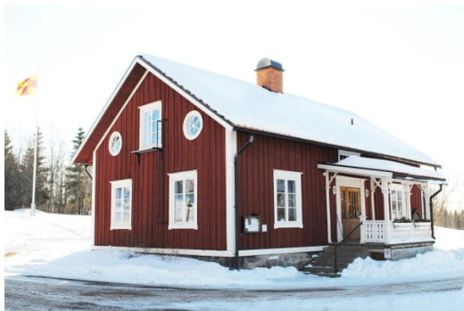
Sockenstugan mars 2010.

Vid ett antal tillfällen under 2010 samlade jag material till en dendrokronologisk undersökning av Sockenstugan, numera församlingshemmet i Säfsnäs, 60° 8' 25" N, 14° 25' 28" E .