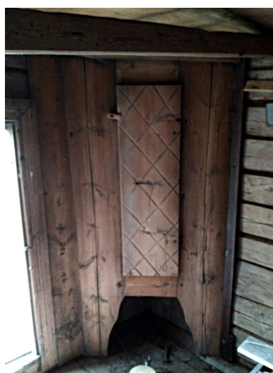
Väggfast hörnskåp, förmodligen ursprungligt från 1849.