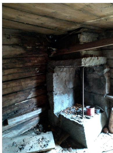
Eldstad av kluven granit. Långvarigt takläckage har skadat taket och bjälken har ruttnat av 2020.