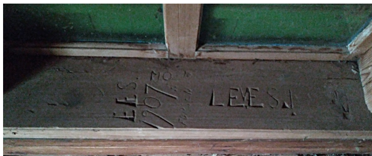
B-fönstrets bänk. Arbetsfolk på Heo i väntan på bättre väder?.