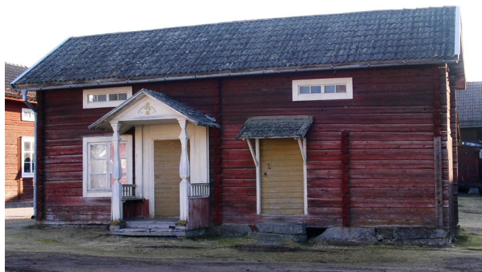
Stugan är timrad tidigast 1872.

av Torbjörn Axelson, mars 2007 (sammanställd 2020)