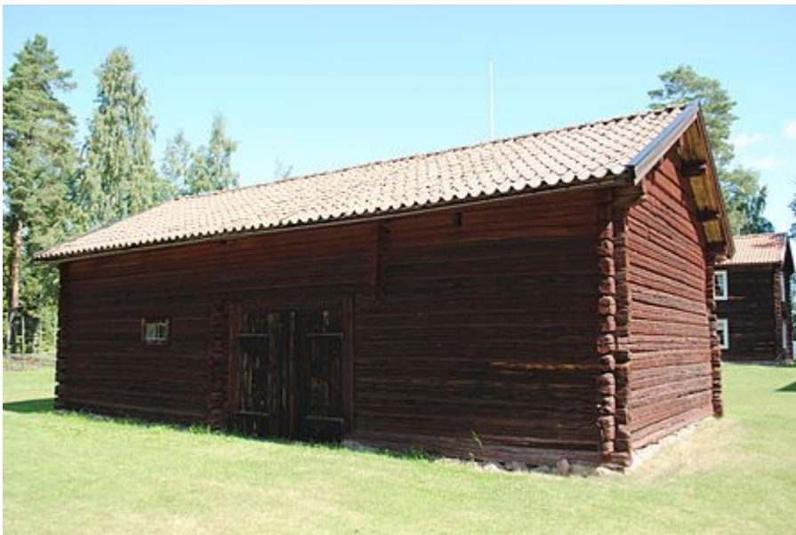
Stallet till vänster, och portlidret från Jansbrända är byggt efter 1775.

Den 13 juli 2011 tog jag med tillväxtborrh fyra prov för dendrokronologisk datering i stallet från Jansbrända ( 60.23889, 14.75 (WGS 84)) nu på Grangärde hembygdsgård, 60.22006, 14.96817 (WGS 84). Proven togs ur stockarna C4b, C5b, C6b, C7b, alltså i stalden på sydvästra långsidan. Det sista provet skadades tyvärr, så att vankant saknas. I de övriga finns vankant, men de två förra har tynande ytved. Yttersta årsring för proven ur C4b och C6b är från 1775. Yttersta synliga ring i provet ur C5b är från 1773, men eftersom det är tynande, så kan det nog ändå vara samtida. Om det fjärde provet är samtida, vilket förefaller troligt, fattas de 11 yttersta ringarna. Virket i stallet torde alltså vara fällt vintern 1775/76, och stallet byggt snart därefter. Stallet är alltså ca 14 år äldre än loftboden som också kommer från Jansbrända. Byggnaderna står i anslutning till varandra på hembygdsgården.