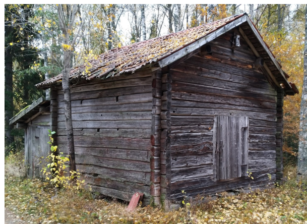
Stalladan delvis av stugtimmer från ca 1872

Den 3 oktober 2020 tog jag några borrhprover i stalladan längst österut på Heo väster om Forsen, 60.46593 , 14.65535 (WGS 84). Ladan är av timmer med inre mått 4,5 m × 4,2 m, och ett anslutet stall bakom C-vägen med inre bredd ca 2,1 m. Stallet är delvis av brädor, men byggt samtidigt med ladan med vissa genomgående timmer. I ladan kan man se att nedre delen av röstet och de nedre stockarna har varit klinade på ett diagonalställt ribbverk. På dessa stockar finns också rester av rödfärg på utsidan. Urtag för takbjälkar syns också. Dessa delar har sannolikt ingått en stuga, vars mått verkar ha varit identiska med den nuvarande byggnadens laddel. Av övriga varv ser några nya ut, medan andra har en grånad som tyder på enstaka år av väder och vind, men nog inte ingått i någon annan byggnad. Ytterligare andra stockar verkar vara återanvända från någon annan byggnad (ej undersökta). Jag tog prov ur flera stockar av det förmodade stugtimret, som alla visar sig ha yttersta ring från 1871. Två prov ur det timmer som ser nytt ur har yttersta ring från 1887 medan det grånade har yttersta ring från 1885. Den nuvarande ladan bör därför ha byggts senast ca 1888, men det är kanske troligt att stugan rivits redan senast 1886, eftersom ladbygget tycks ha varit påbörjat då. Knutningen är i huvudsak gjord med enkelkattknutar och skallarna kapade med en grovtandad såg.