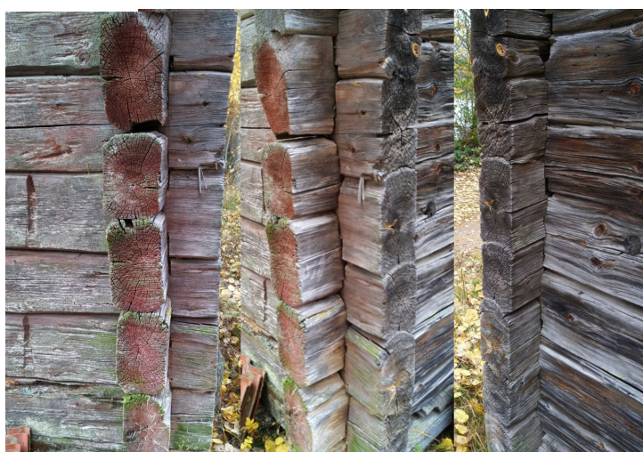
Del av knutkedjan A-B sedd från tre håll. Skallarna har kapats med en mycket grovtandad såg och långdragen löper delvis ut under skallarna. En blek rest av rödfärg är kvar.