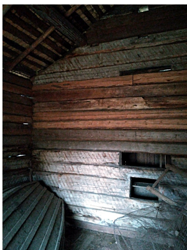
Stugtimret har varit klinat på ett diagonalt ribbverk.