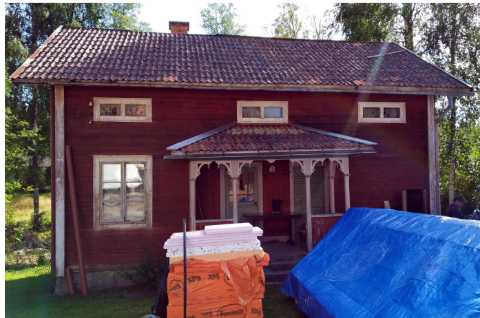
Lillstugan från ca 1859 och ombyggd 1915 i augusti 2020.

Den 7 augusti 2020 tog jag fem borrprover i "arstugu" på Gronbacken i Forsen, 60.46012 , 14.68408 ( WGS 84 ). Proven togs i den lilla skrubben som bildats vid hörnet A-D genom att timmerväggen flyttats in för att ge plats för trappa till vinden från egen ytterdörr. De nya knutarna är framställda med såg. Timret i skrubben är grånat och har en tid varit yttervägg. Prov togs i D5, D6, D9 och D10, som alla visar sig vara av träd fällda vinterhalvåret 1858/59. Tre av dessa är av omkring 80-åriga tallar från samma bestånd (samma träd kan inte uteslutas), och en är av en över 130-årig gran. Prov togs även i en uppenbarligen nyare stock, Ad13, en tallstock med något blånad yttersta ring från 1913. På klovstensgrunden (vägg B) kan man läsa årtalet 1915 inhugget. Stugan timrades således ursprungligen ca 1859 och timrades om på den nya klovstensgrunden ca 1915 (tidigast 1914).